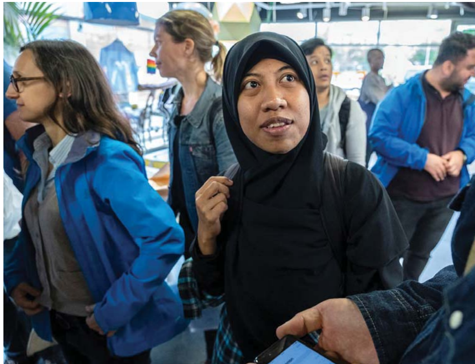
Deltagare i kursen "Hållbara inkluderande och klimatrelianta städer" fick en rundvandring till några av Lunds sevärdheter, till exempel Sankt Hans backar, Smörlyckans ip och Skarpskyttevägen.